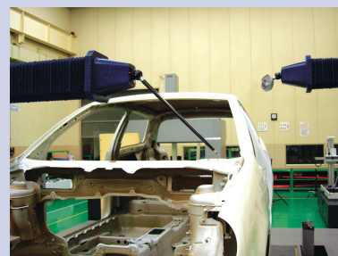
Exemplo de aplicação do modelo DUAL (equipado com sensor de contato e sensor de medição LASER)

*Alguns modelos são fabricados sob consulta. Contate-nos para mais informações.